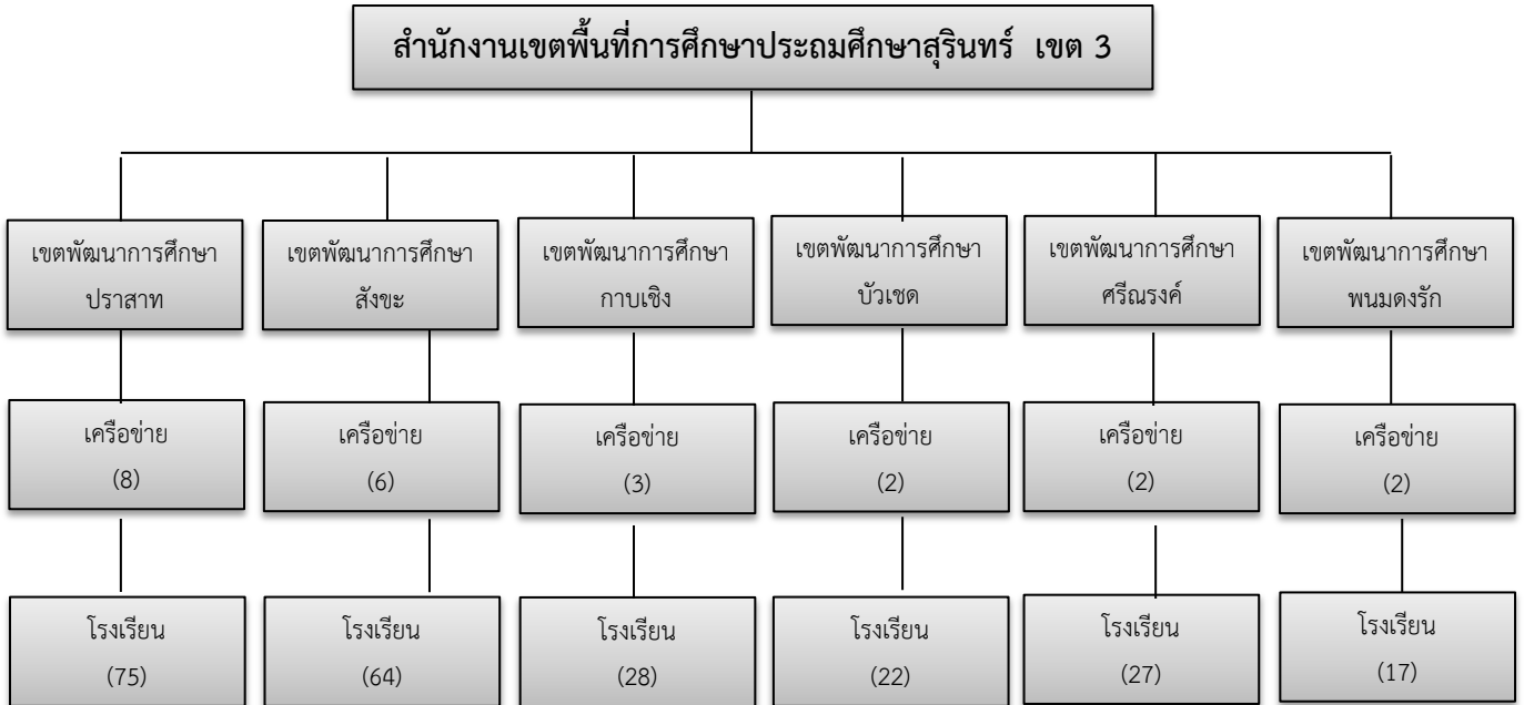
แผนภูมิที่ 2 แสดงโครงสร้างการบริหารเขตพัฒนาการศึกษา